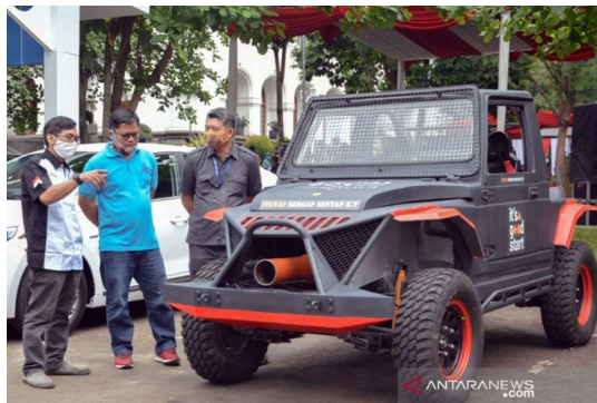
Gambar 3.2. Mobil Listrik (Kristyadi, 2024)

Contoh penulisan gambar adalah sebagai berikut: